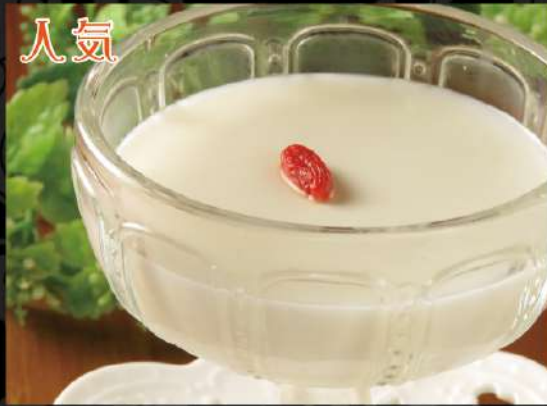
自家製とろ〜り杏仁豆腐 360 (税込396)