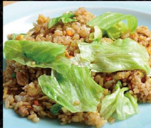
プラス110円(税込)で大盛りできます！