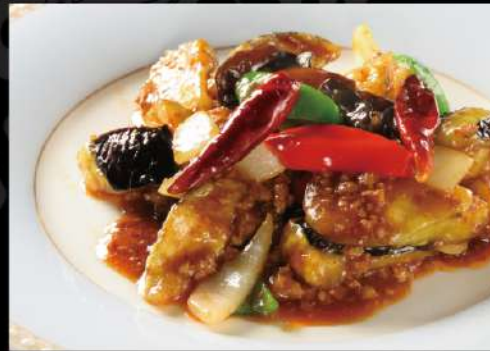
麻婆茄子 850 (税込935)