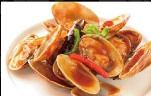
あさりのピリ辛炒め 790 (税込869)