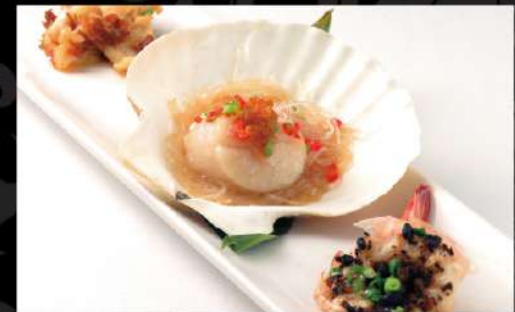
海の幸3種蒸し合わせ 1,090 (税込1,199) ※帆立貝柱、つぶ貝、ぶりぶり大正海老