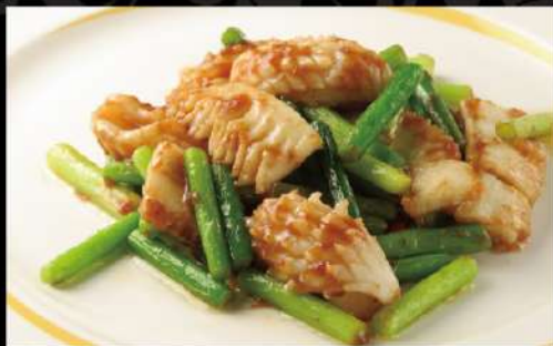
いか二種の台湾特製醬の炒め 890 (税込979)