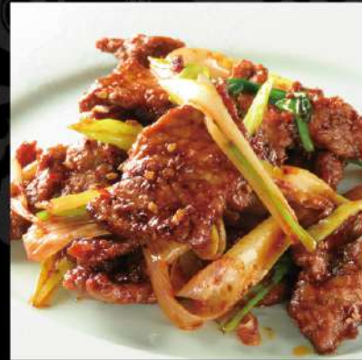
牛肉のクミンスパイス炒め 950 (税込1,045)