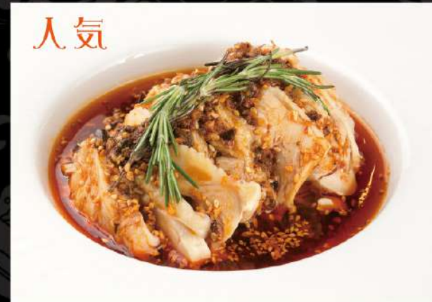
よだれ鶏 690 (税込759)