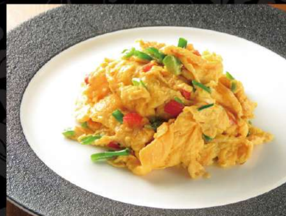
田舎風海老入り玉子炒め 850 (税込935)