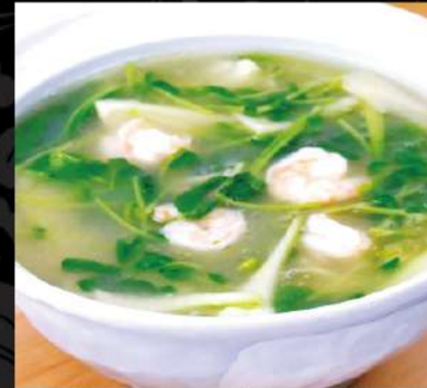
海老と青菜のとろみ塩タン麵 850 (税込935)