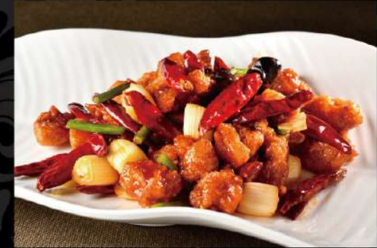
揚げ鶏の唐辛子炒め 890 (税込979)