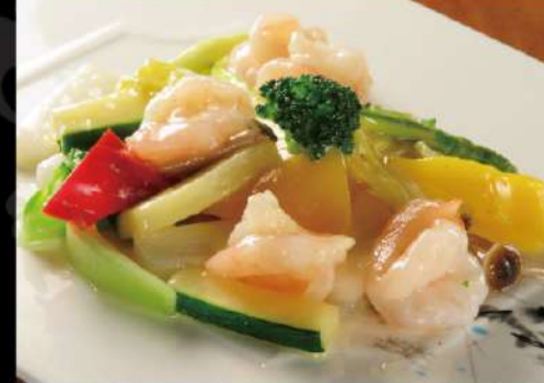
海老と季節野菜の黒胡椒炒め 950 (税込1,045)