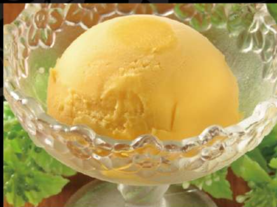
マンゴーアイス 350 (税込385)