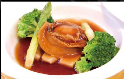
活き鮑のオイスターソース煮 1,990 (税込2,189)