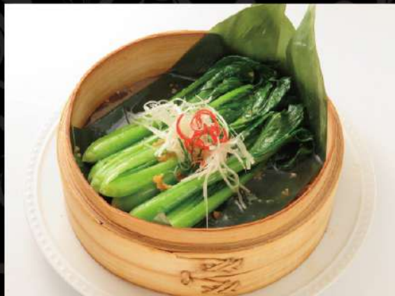
青菜の特製たれセイロ蒸し 790 (税込869)