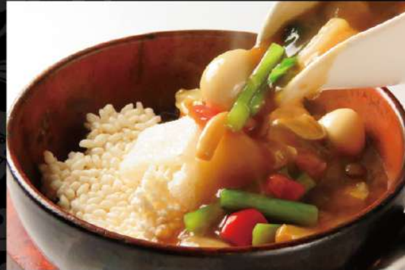
海の幸と野菜の熱々おこげ