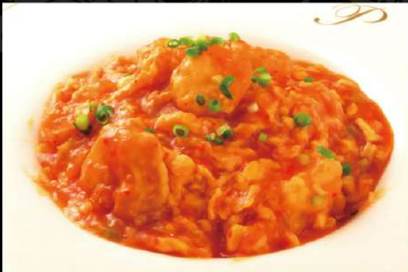
海老と玉子のチリソースかけご飯