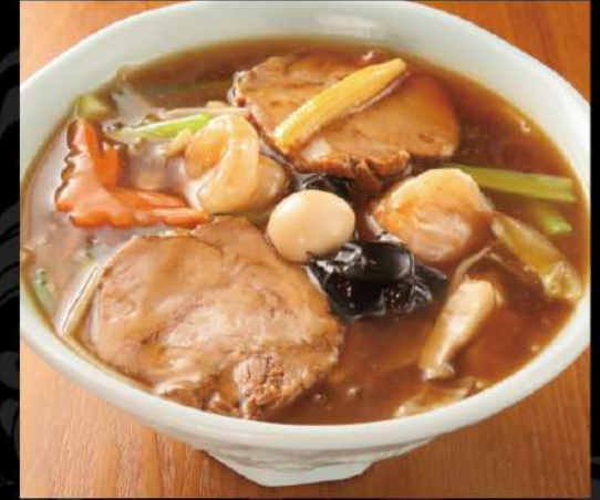
具たくさん広東麵 950 (税込1,045)