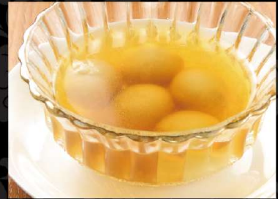
黒胡麻あんの白玉団子 390 (税込429)