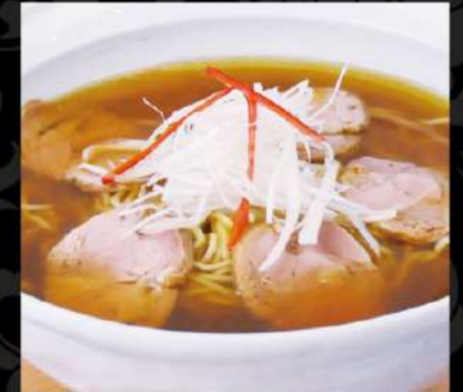
自家製チャーシュー醤油麵 800 (税込880)