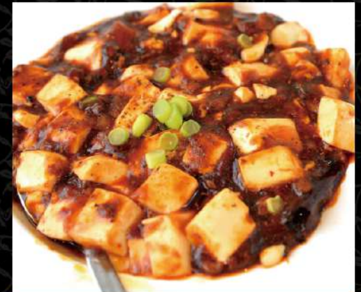
コクのある辛さが自慢です！辛さ調節可