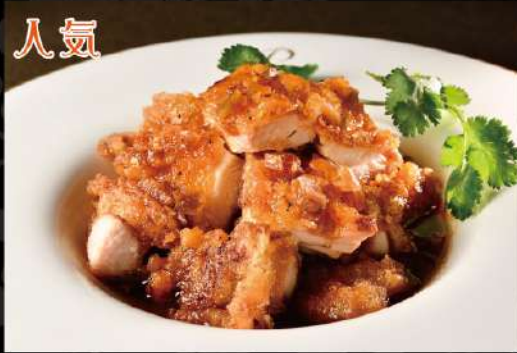
特製香味油淋鶏 唐苑特製ソース 850 (税込935)