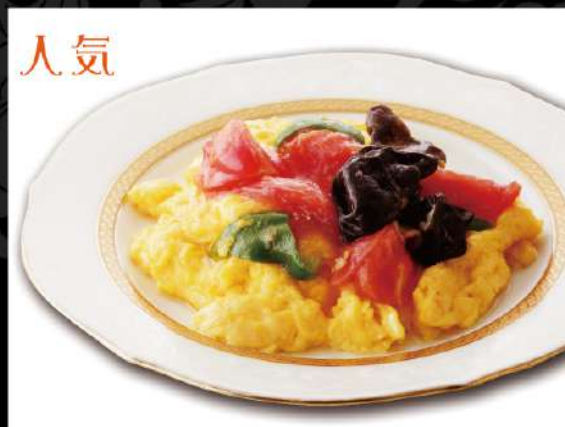
トマトとふわふわ玉子炒め 790 (税込869)