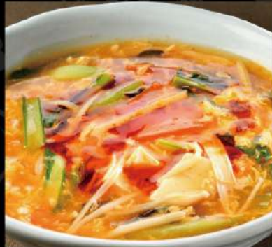
酸辣湯麵 850 (税込935)