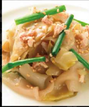
ザーサイ (塩味 or ピリ辛)