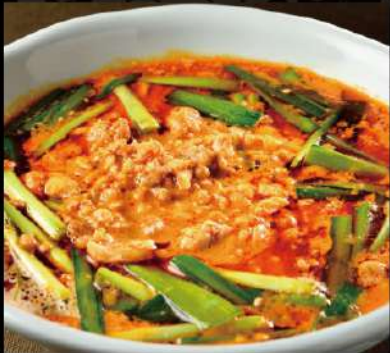
唐苑特製麻辣麵 950 (税込1,045)