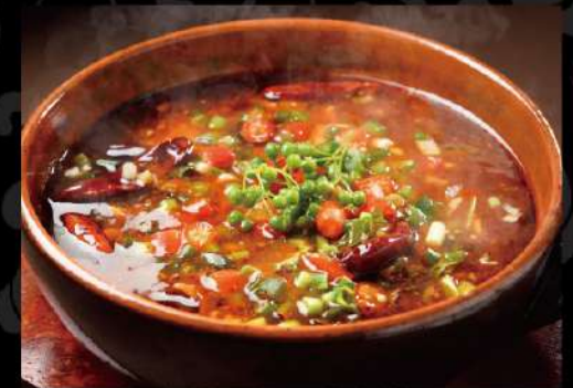
四川名菜・水煮牛肉 1,390 (税込1,529) (牛肉の山椒唐辛子煮込み)