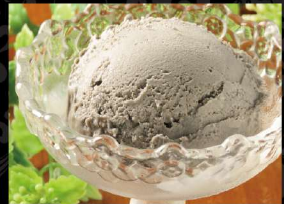
黒胡麻アイス 350 (税込385)