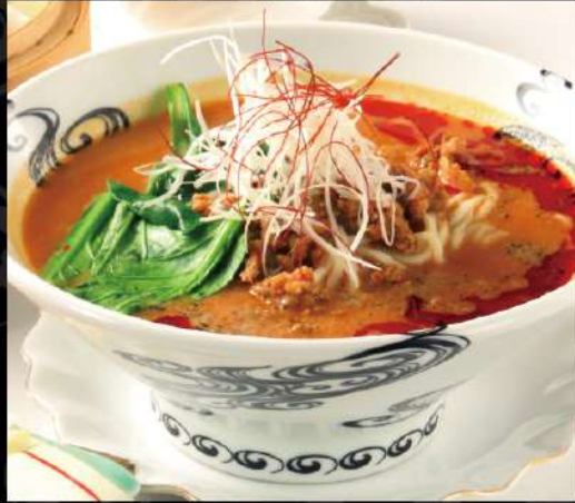
大人気の濃厚担々麵 890 (税込979)