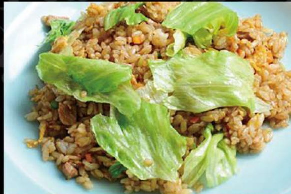
自家製チャーシューレタスチャーハン