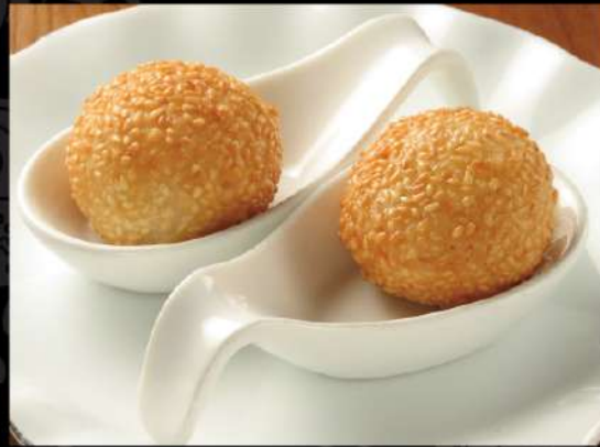
ごま団子 2個 360 (税込396)