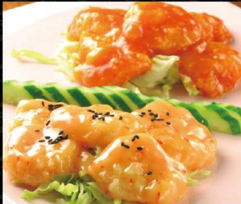
どちらも食べたい！おすすめの満足セット

◆13時以降ご入店のお客様にはコーヒー及びウーロン茶のフリードリンクをお付けいたします(平日のみ)◆