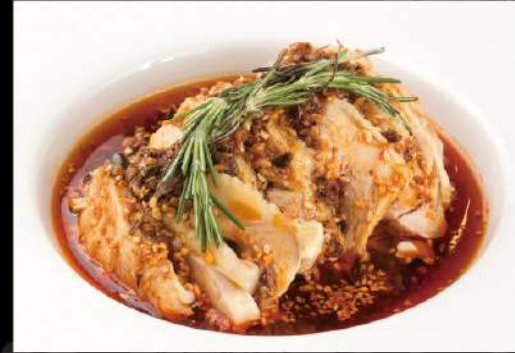
よだれ鶏 690 (税込759)