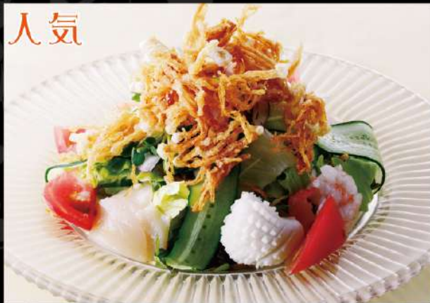
大人気の海鮮サラダ 790 (税込869)