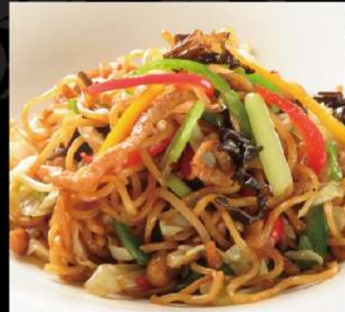
特製オイスターソース焼きそば 950 (税込1,045)