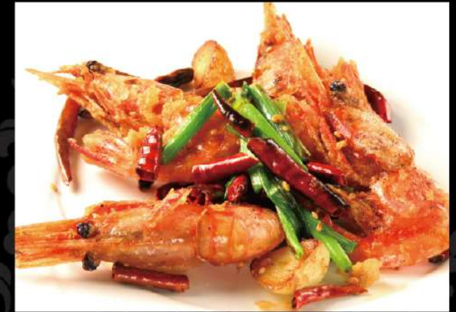
殻付海老のピリ辛香ばし揚げ 890 (税込979)

※1個から追加できます。食べ応えのある大海老です。 甘さと辛さのバランスが絶妙！