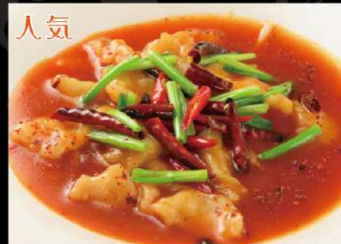
四川名菜・水煮魚 1,390 (税込1,529) (真鯛の山椒唐辛子煮込み)