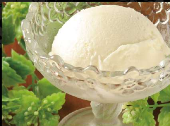
バニラアイス 300 (税込330)