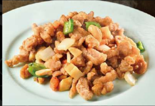
カリッと香ばしい鶏肉のカシューナッツ炒め 850 (税込935)