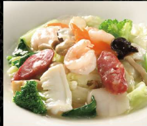
野菜たっぷりあっさり塩味が人気！