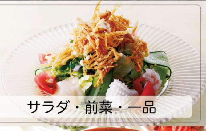
サラダ・前菜・一品