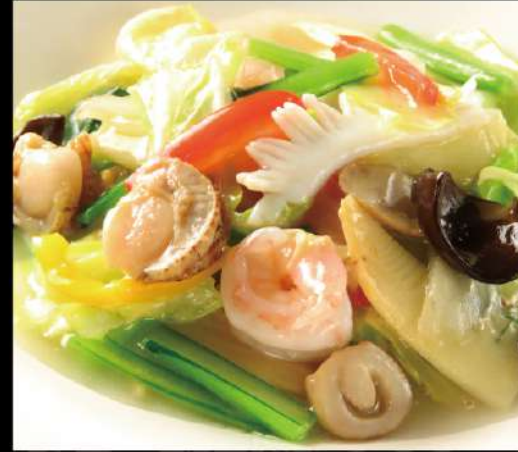
海鮮三種の塩あんかけ焼きそば 950 (税込1,045)