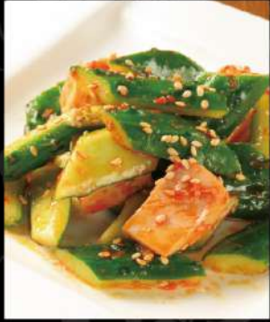
たたき胡瓜 (塩味 or ピリ辛)