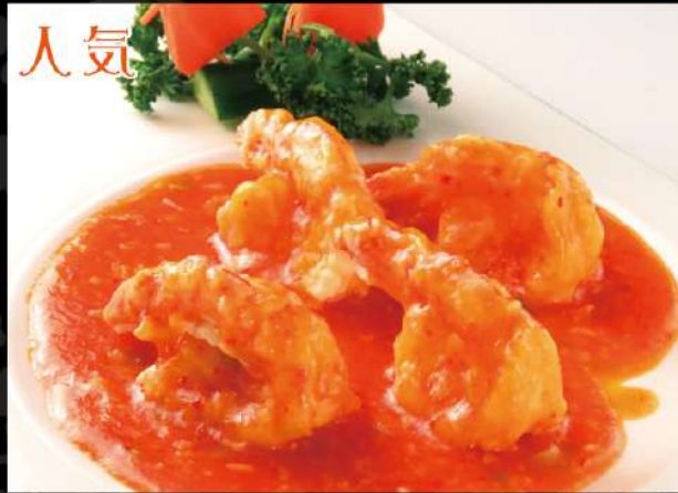
大海老のチリソース 890 (税込979)

※1個から追加できます。食べ応えのある大海老です。 甘さと辛さのバランスが絶妙！