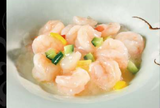
海老のあっさり岩塩炒め 950 (税込1,045)