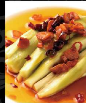
蒸し茄子の特製ソース