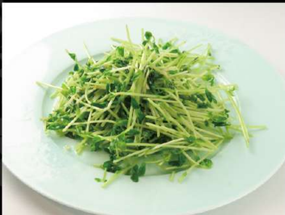
豆苗のシャキシャキ炒め 690 (税込759)