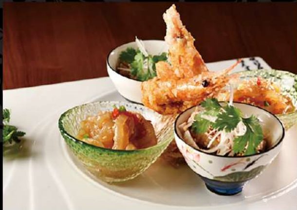
本日の前菜三種盛り合わせ (2人前) 990 (税込1,089)