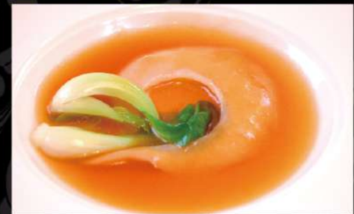
気仙沼フカヒレの醤油姿煮 3,190 (税込3,509)