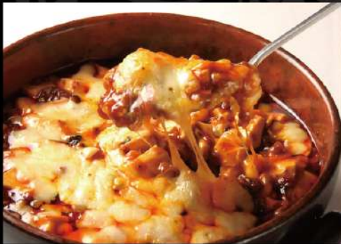
とろ〜りチーズ入り麻婆豆腐 1,050 (税込1,155)