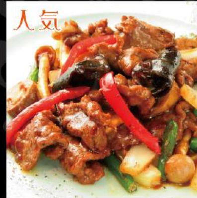
牛肉の黒胡椒炒め 950 (税込1,045)