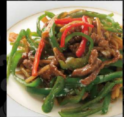
青椒肉絲 890 (税込979)