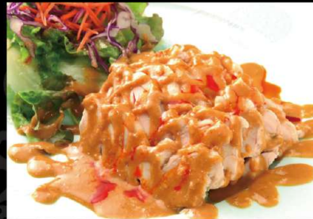
棒棒鶏サラダ 790 (税込869)