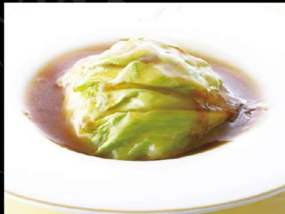
レタスのオイスターソース炒め 790 (税込869)